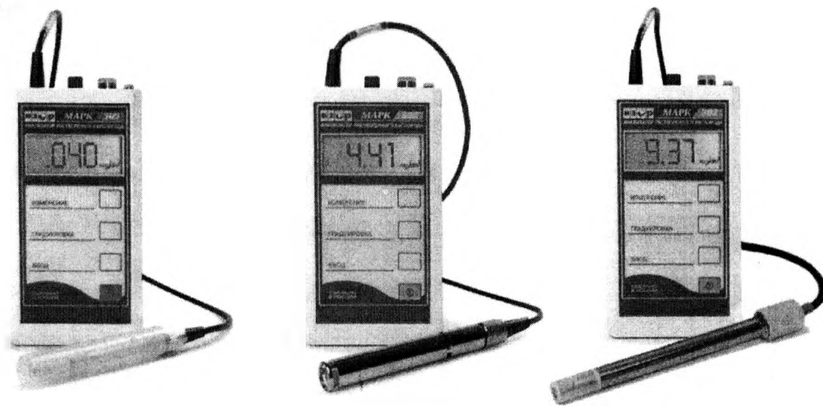
а – МАРК-302Т