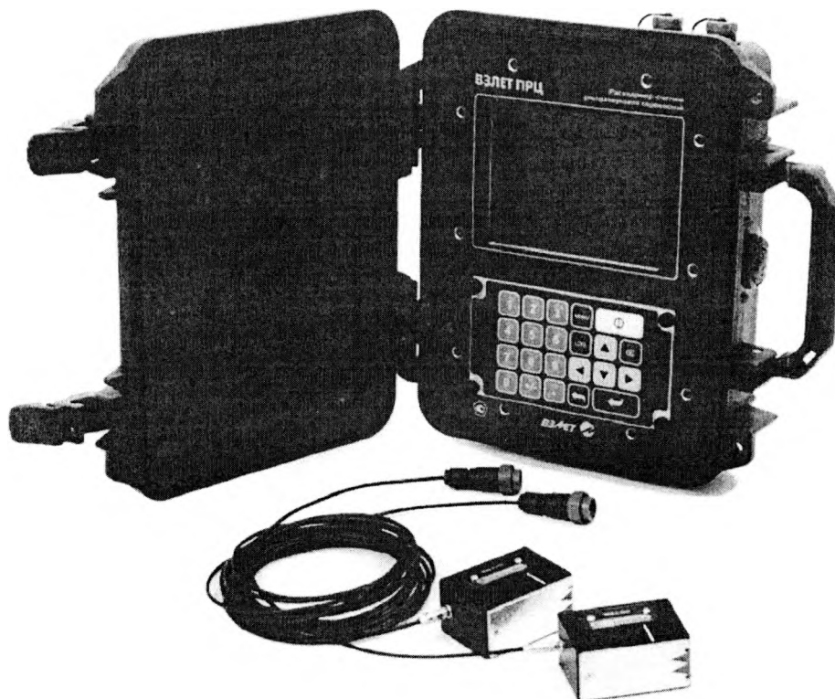
Рисунок 1 - Общий вид расходомеров-счетчиков ультразвуковых переносных «ВЗЛИЕТ ПРЦ»

Общий вид расходомеров приведен на рисунке 1.