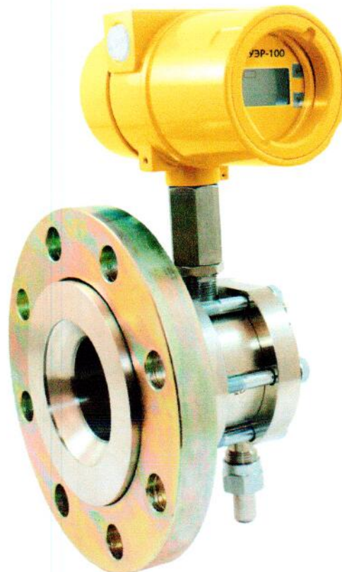
Рисунок 4 – Общий вид датчиков давления СУЭР-100-ДГ.