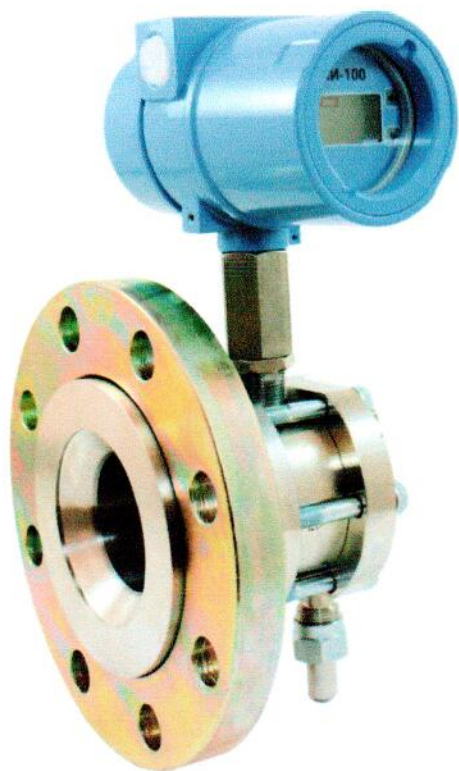
Рисунок 3 – Общий вид датчиков давления ЭНИ-100-ДГ.