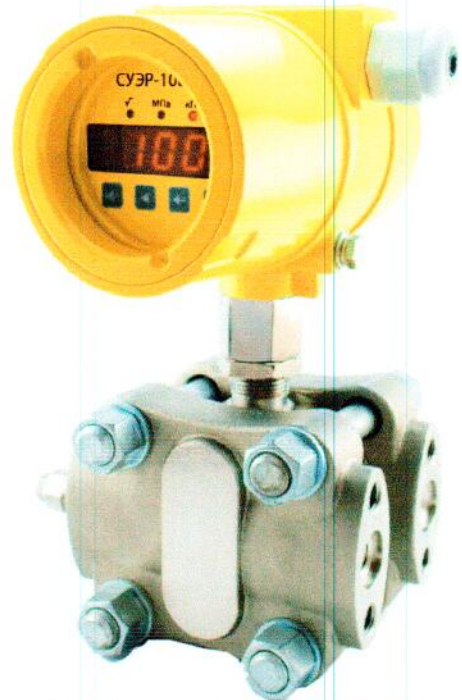
Рисунок 6 – Общий вид фланцевых датчиков давления СУЭР-100-ДИ, СУЭР-100-ДА, СУЭР-100-ДВ, СУЭР-100-ДИВ, СУЭР-100-ДД.