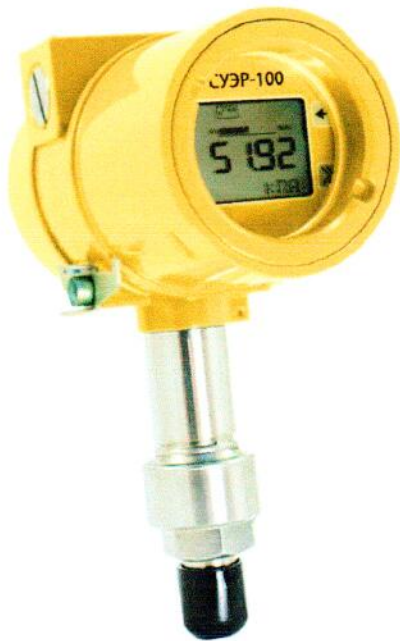
Рисунок 5 – Общий вид штуцерных датчиков давления СУЭР-100-ДИ, СУЭР-100-ДА, СУЭР-100-ДВ, СУЭР-100-ДИВ.