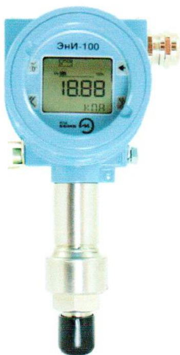
Рисунок 1 – Общий вид штуцерных датчиков давления ЭНИ-100-ДИ, ЭНИ-100-ДА, ЭНИ-100-ДВ, ЭНИ-100-ДИВ.