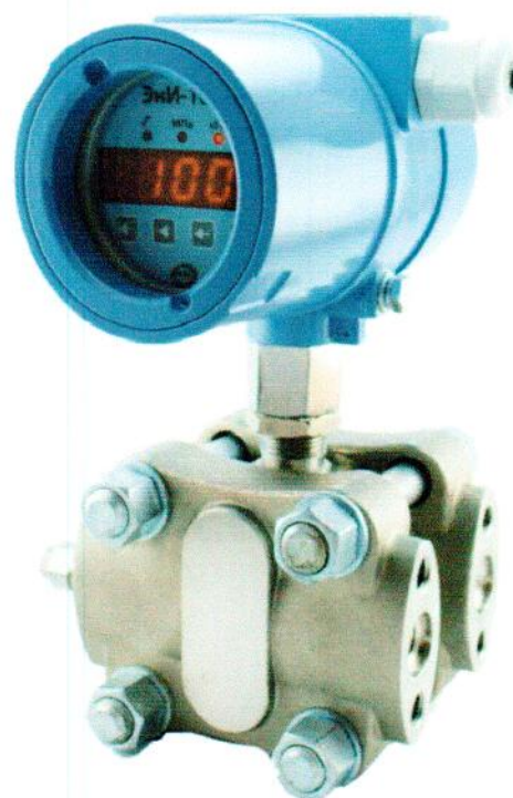
Рисунок 2 – Общий вид фланцевых датчиков давления ЭНИ-100-ДИ, ЭНИ-100-ДА, ЭНИ-100-ДВ, ЭНИ-100-ДИВ, ЭНИ-100-ДД.