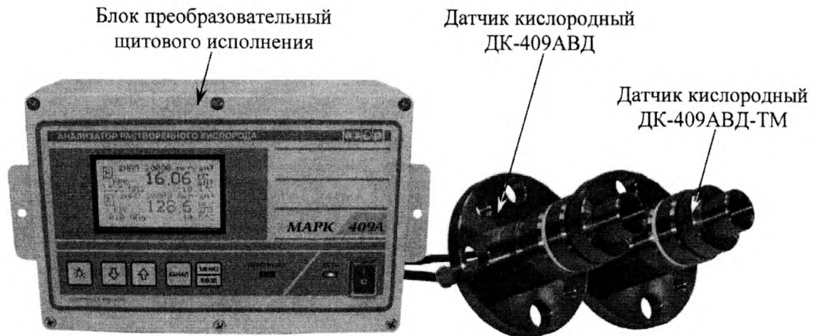
Рисунок 1 - Общий вид анализатора