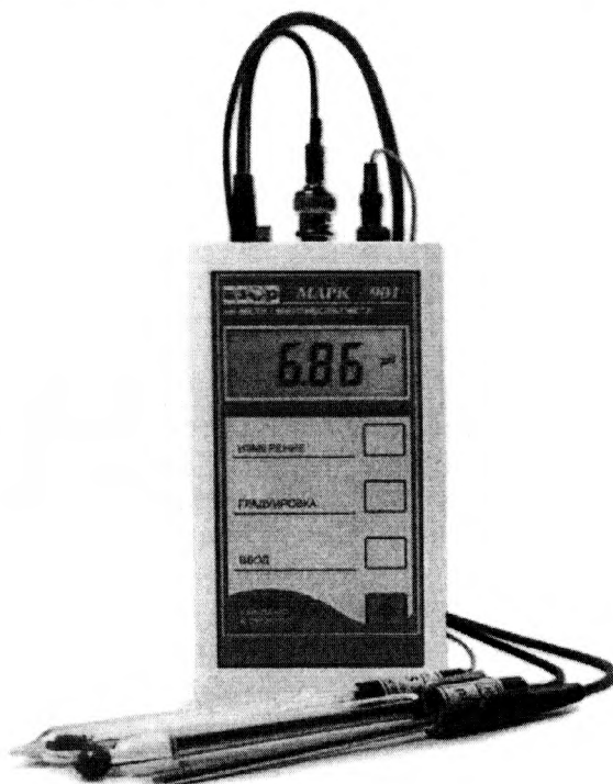
Рисунок 1 - Общий вид рН-метра

Схема пломбирования от несанкционированного доступа к элементам конструкции, обозначение места нанесения знака поверки представлены на рисунке 2.