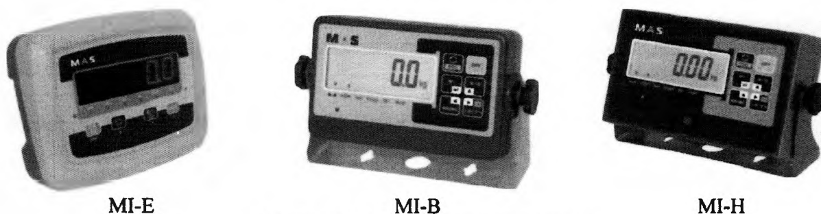
Рисунок 2 - Общий вид индикаторов