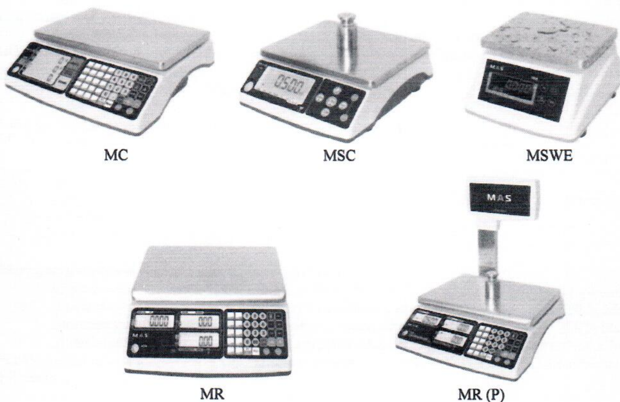
Рисунок 1 - Общий вид модификаций весов