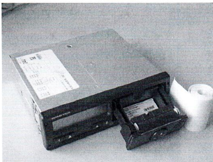
РИСУНОК 1- ВНЕШНИЙ ВИД ТАХОГРАФА ЦИФРОВОГО DTCSO 1381