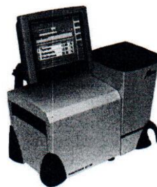
Рис.1 - Внешний вид анализаторов «ИнфраЛЮМ ФТ». а - модификация «ИнфраЛЮМ ФТ-10», б - модификация - «ИнфраЛЮМ ФТ-12», в - модификация «ИнфраЛЮМ ФТ-40»