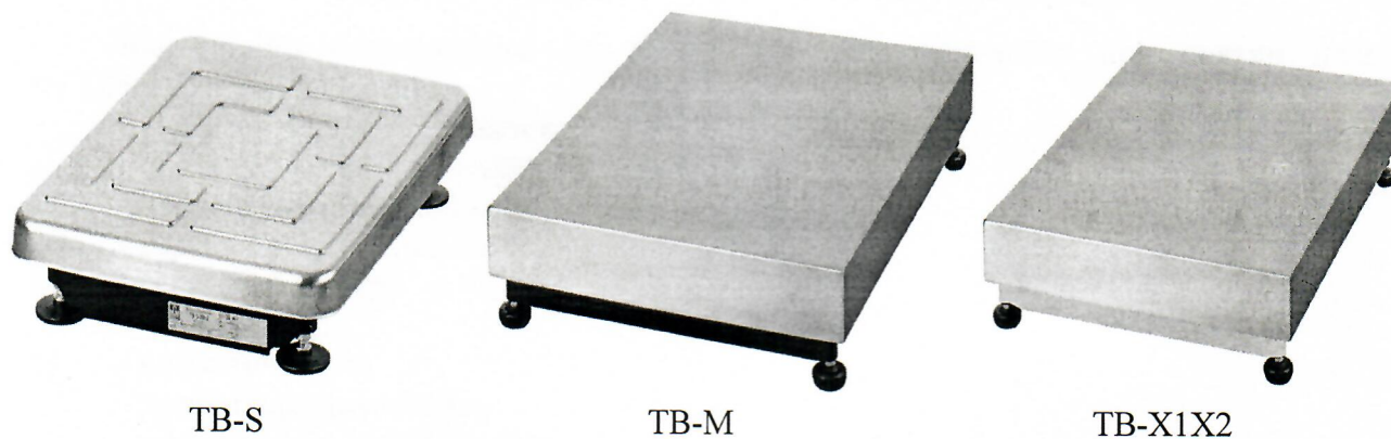
Рисунок 1 – Варианты исполнения грузоприёмной платформы

Варианты исполнения модуля отличаются габаритными размерами, массой, формой грузоприемной платформы и материалом из которых изготовлены основание и корпус.