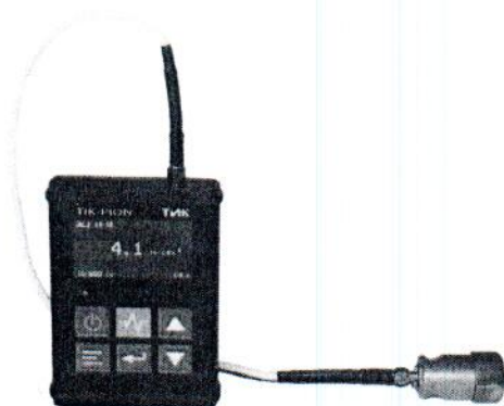
Рисунок 1 - Внешний вид виброметра «ТИК-ПИОН» (TIK-PION)

Внешний вид виброметра «ТИК-ПИОН» (TIK-PION) приведен на рисунке 1.