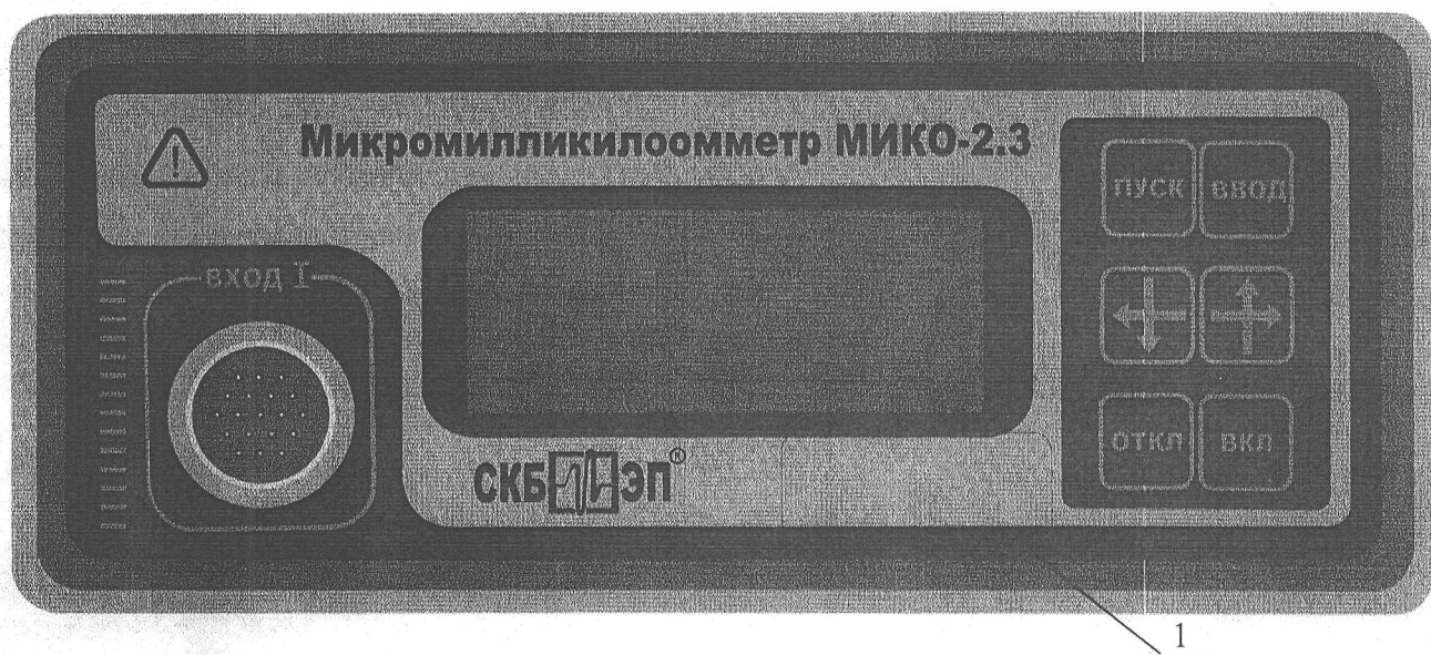
Рис. 2. Схема панели

1. Место для нанесения оттисков клейм или размещения наклеек.