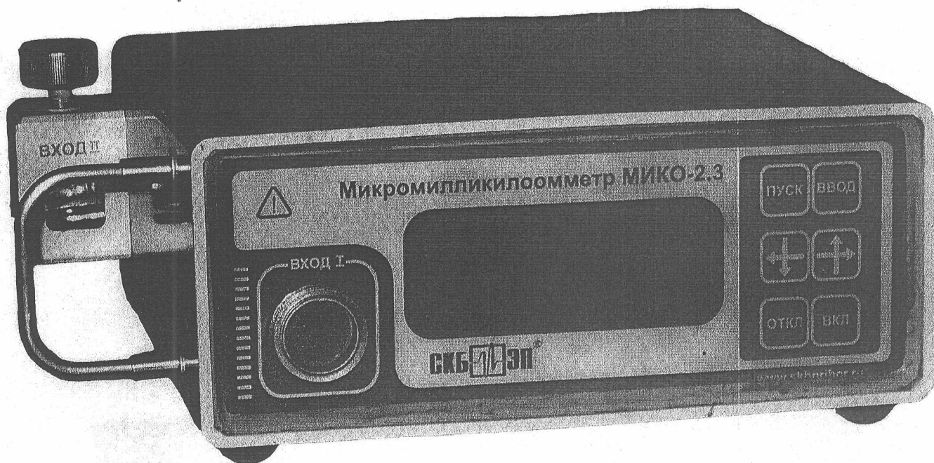
Рис. 1 Измерительный блок

Программное обеспечение не оказывает влияния на метрологические характеристики прибора.