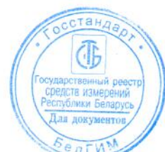
Рисунок А.1 – Схема с указанием места нанесения знака поверки (клейма-наклейки)

Место нанесения знака поверки (клейма-наклейки)