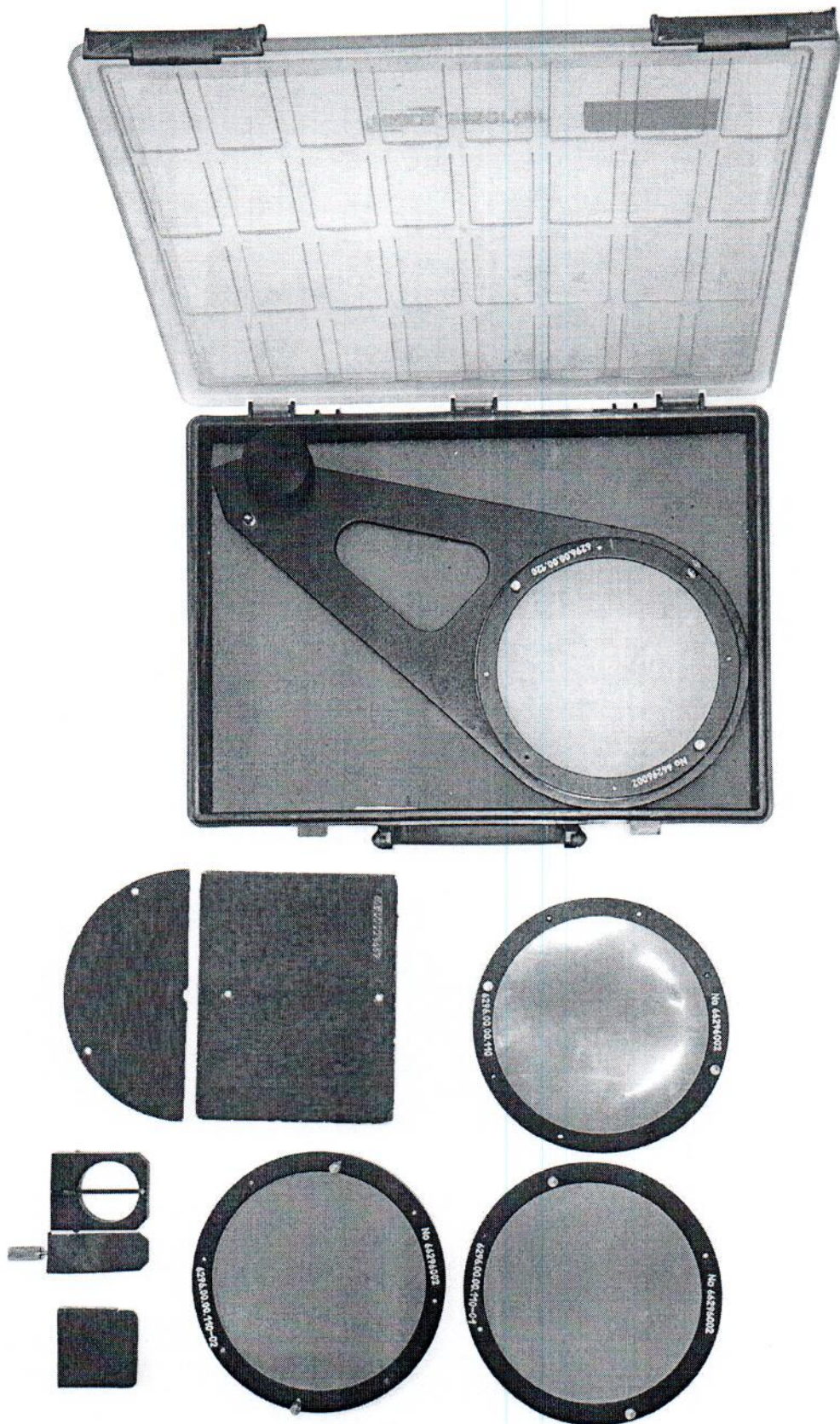
Рисунок 1 – Внешний вид комплекта