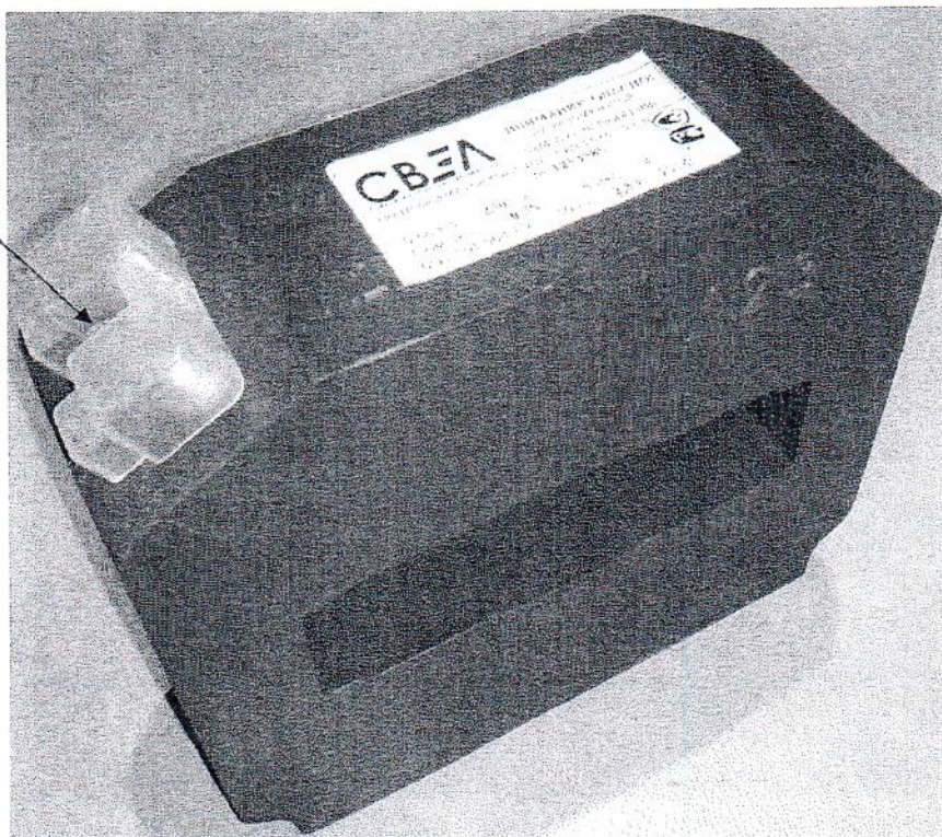
Рисунок 1 - Общий вид трансформаторов тока ТШЛ-СВЭЛ-0,66