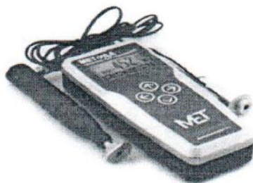
Рисунок 3 – Внешний вид твердомера МЕТ-УДА

Внешний вид твердомера МЕТ-УДА приведён на рисунке 3, схема пломбировки от несанкционированного доступа на рисунке 4.