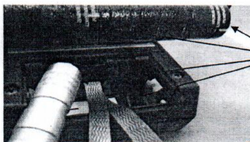
Рисунок 2 - Схема пломбировки твердомера.