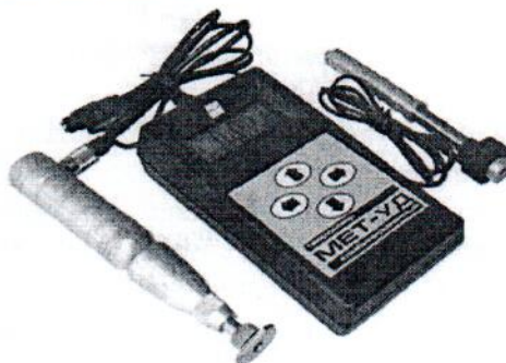
Рисунок 1 – Внешний вид твердомера МЕТ-УД

Внешний вид твердомера МЕТ-УД приведён на рисунке 1, схема пломбировки от несанкционированного доступа на рисунке 2.