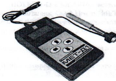
Рисунок 1 – Внешний вид твердомера МЕТ-Д1

Внешний вид твердомера МЕТ-Д1 приведён на рисунке 1, схема пломбировки от несанкционированного доступа на рисунке 2.