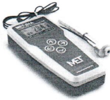
Рисунок 3 – Внешний вид твердомера MET-D1A