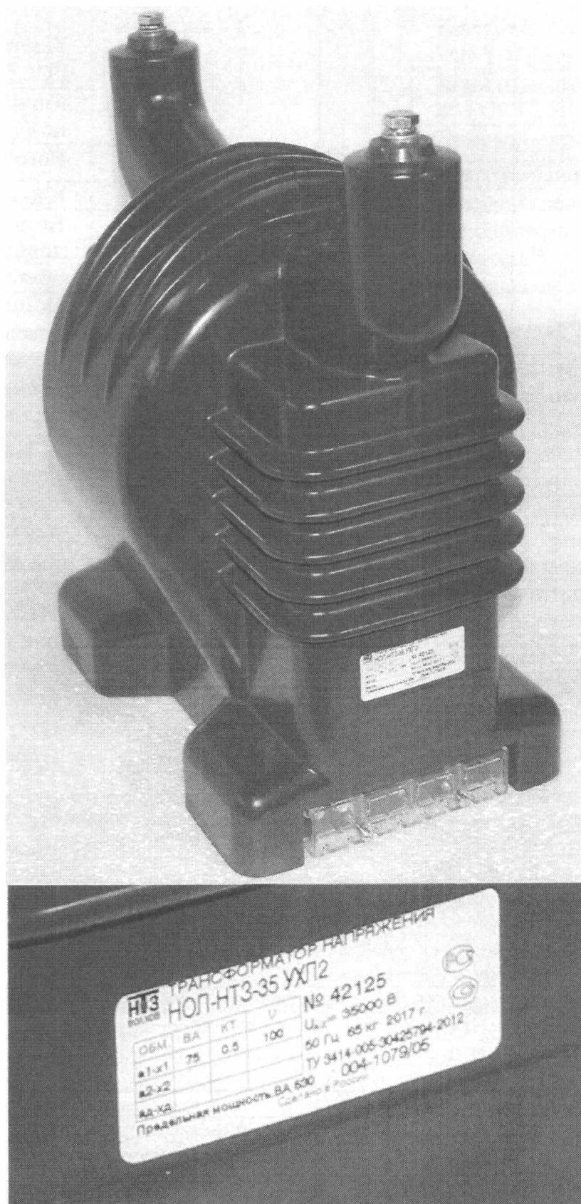
Рисунок 2 - Общий вид трансформаторов напряжения НОЛ-НТЗ-35