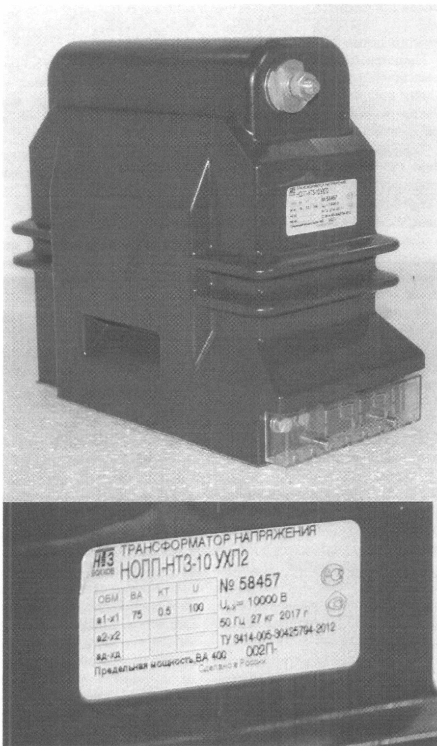
Рисунок 1 - Общий вид трансформаторов напряжения НОЛП-НТЗ-6(10)

Рабочее положение трансформаторов в пространстве - любое.