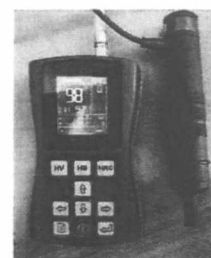
Рисунок 2. - Внешний модификации ТКМ-