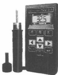
Рисунок 1.- Внешний вид вид модификации ТКМ-459М 459С

Модификация ТКМ-459С оснащается цветным дисплеем, содержит расширенный набор сервисных функций программного обеспечения. Модификация ТКМ-459М оснащается чёрно-белым дисплеем, содержит сокращённый набор сервисных функций ПО. Метрологические характеристики у модификаций твердомера одинаковые.