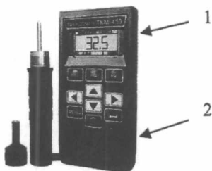
Рисунок 3. - схема пломбировки пломки модификации ТКМ-459М 1,2-места пломбировки