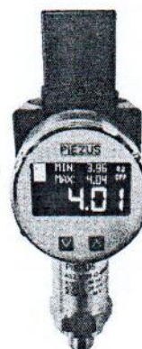
Рисунок -4 Общий вид датчиков давления емкостных ASZ