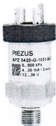
Рисунок 1 - Общий вид датчиков давления емкостных APZ