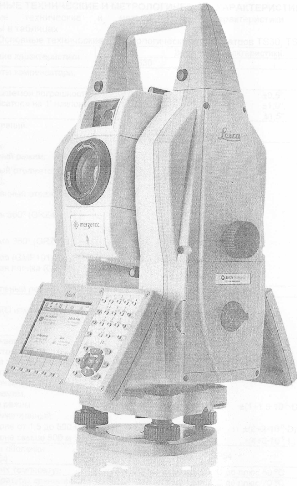
Рисунок 1 – Внешний вид тахеометра