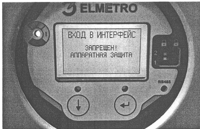
Рисунок 3 - Место пломбирования расходомера и сообщение на дисплее при запрещающем положении микропереключателей.

Защита ПО расходомера от непреднамеренных и преднамеренных изменений соответствует уровню «высокий» по Р 50.2.077-2014.