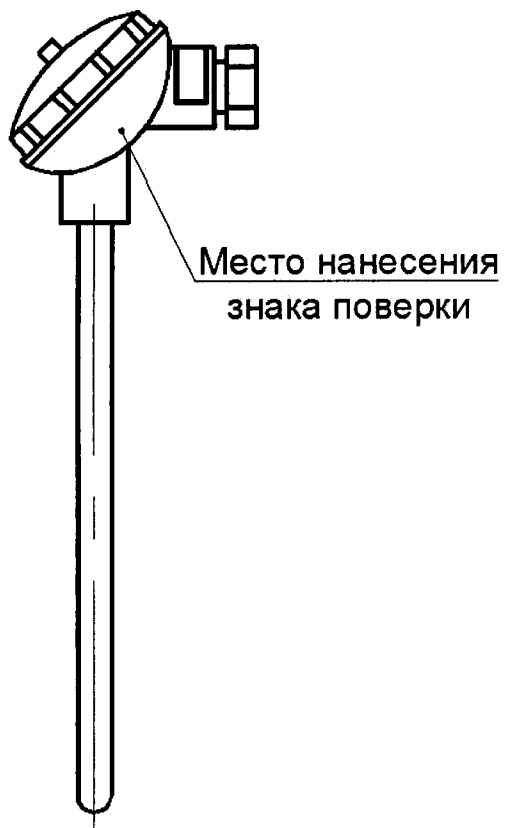
Рисунок А.1 – Место нанесения знака поверки

Место нанесения знака поверки (клейма-наклейки)