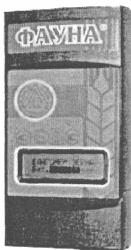
Рисунок 1 – Фото общего вида влагомера «ФАУНА-М»

Общий вид влагомера представлен на рисунке 1.