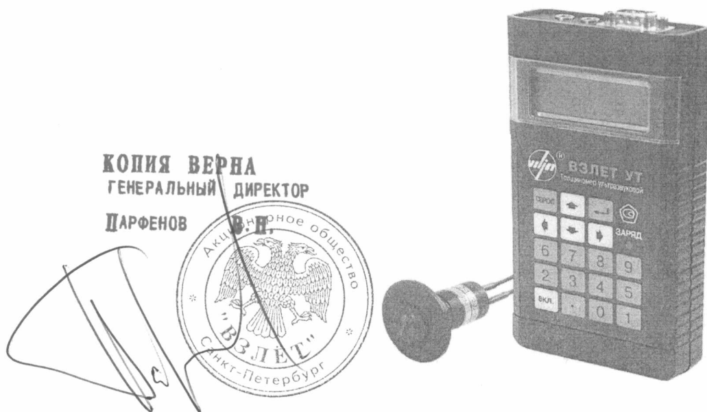
Рисунок 1 - Общий вид толщиномеров ультразвуковых «ВЗЛЕТ УТ».