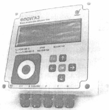
Рисунок 1. Общий вид блока коррекции объема газа «ФЛОУГАЗ».

Вычислитель микропроцессорный представляет собой микроЭВМ, выполненную на базе современной микропроцессорной технологии, позволяющей производить с высокой точностью измерение требуемых параметров, проведение вычислений, а также хранение и вывод информации на внешние устройства.