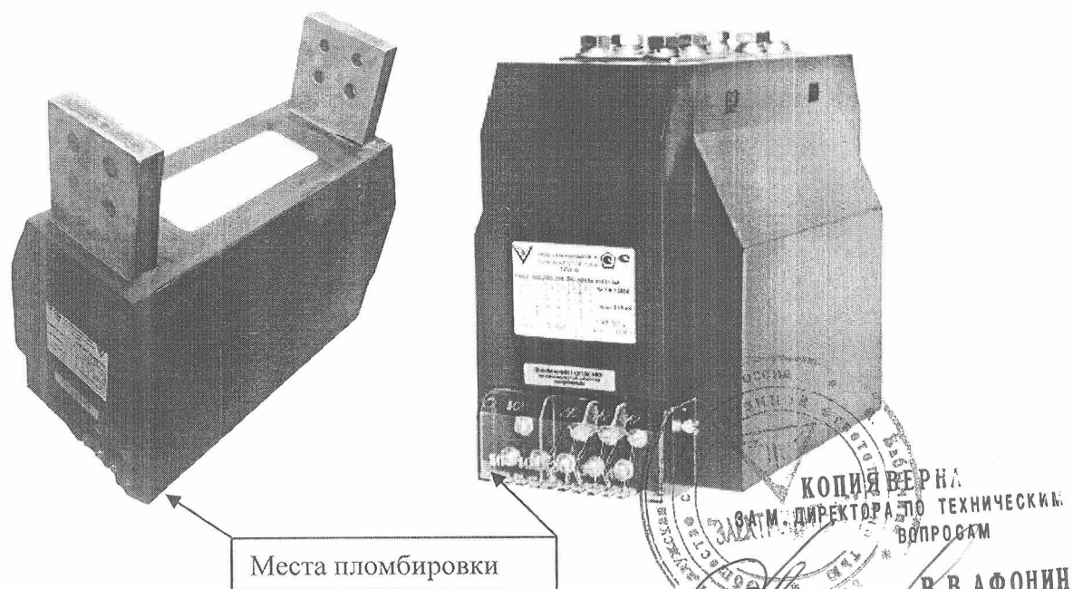
Рисунок 1 – Фотографии внешнего вида трансформаторов тока

Место нанесения паспортной таблички, поверительного клейма и знака утверждения типа приведены на рисунке 2.