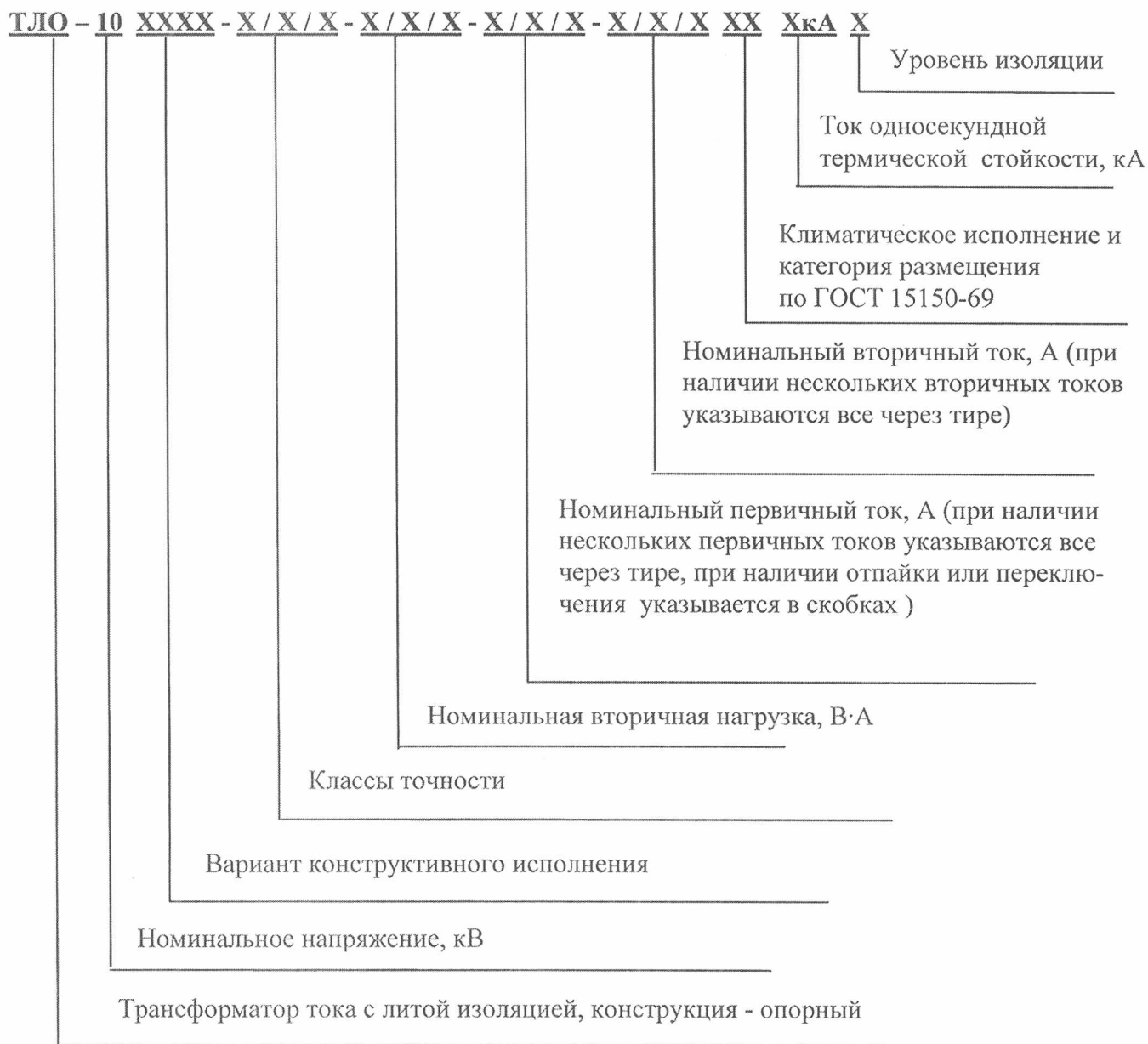
Рисунок 3 – Расшифровка условного обозначения трансформаторов