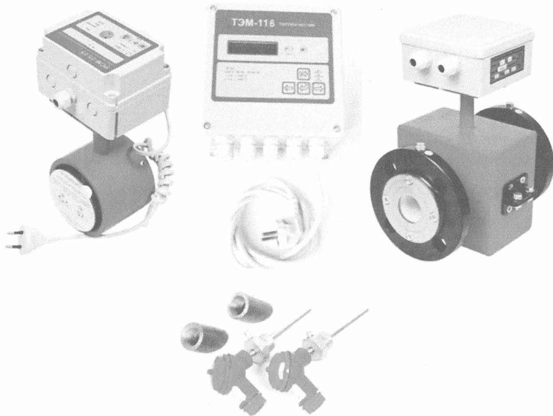
Рисунок 1 – Внешний вид теплосчетчика ТЭМ-116

Схема пломбировки теплосчетчика для защиты от несанкционированного доступа к элементам конструкции с указанием мест для нанесения оттиска клейма со знаком поверки и знака поверки в виде клейма-наклейки приведена в Приложении Б к описанию типа.