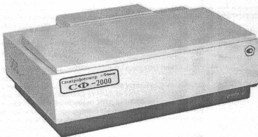
Рисунок 1 – Внешний вид спектрофотометра СФ-2000

Общий вид спектрофотометров приведен на рисунке 1, схема опломбирования на рисунок 2.