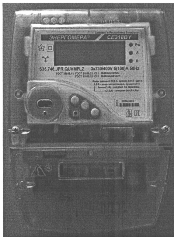
Рисунок 3 – Внешний вид счетчиков электрической энергии CE318BY, корпус R35