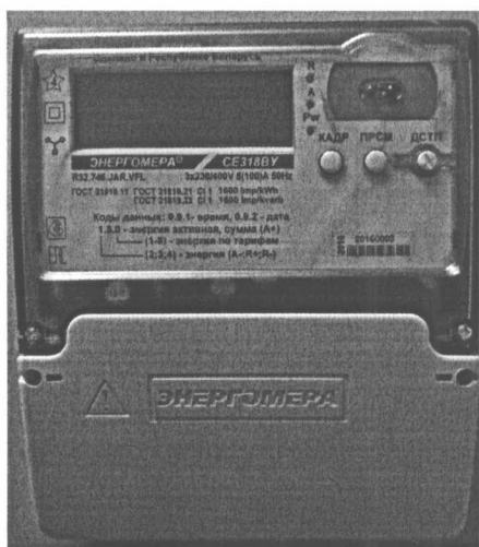
Рисунок 2 – Внешний вид счетчиков электрической энергии CE318BY, корпус R32

Внешний вид счетчиков CE318BY приведен на рисунках 2 и 3.