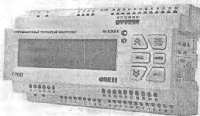
Рисунок 1 - Общий вид приборов

Фотография общего вида приборов приведена на рисунке 1.