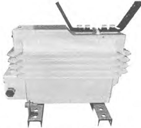
Рисунок 1 – Общий вид трансформаторов комбинированных наружной установки НТОЛП-НТЗ-6-IV, НТОЛП-НТЗ-10-IV, ЗНТОЛП-НТЗ-6-IV, ЗНТОЛП-НТЗ-10-IV

Общий вид трансформаторов комбинированных представлен на рисунке 1.