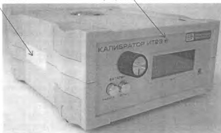
Рисунок 1 – Внешний вид калибратора ИТ23