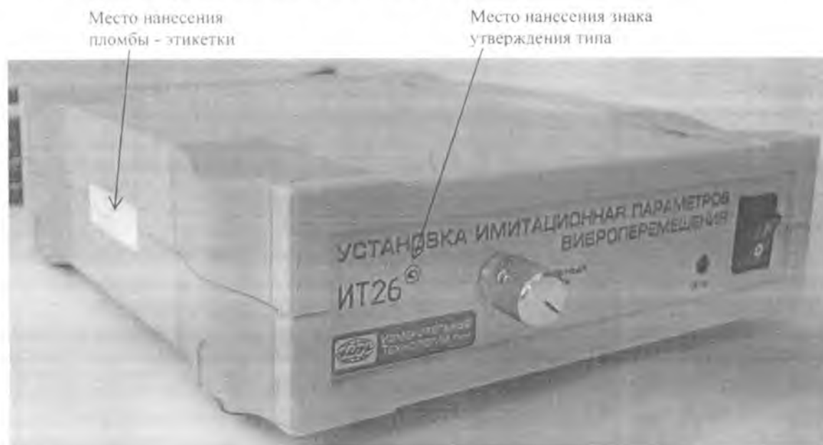
Рисунок 1 Внешний вид установки имитационной параметров виброперемещения ИТ26

Внешний вид установки ИТ26 показан на рисунке 1.