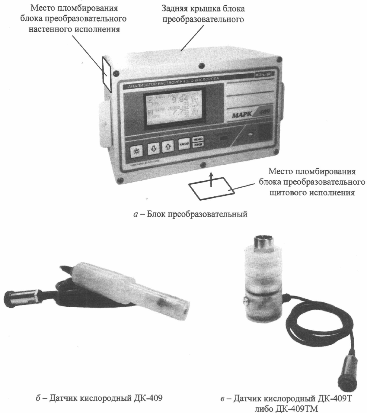
Рисунок 1 – Анализатор растворенного кислорода МАРК-409