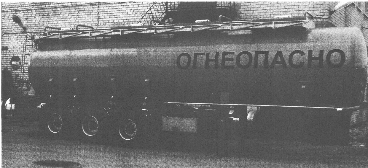
Фото 1. Общий вид полуприцепа-цистерны ППЦ-СН

На боковых сторонах и сзади цистерна имеет надпись «ОГНЕОПАСНО», знак ограничения скорости и знаки с информационными табличками для обозначения транспортного средства, перевозящего опасный груз.